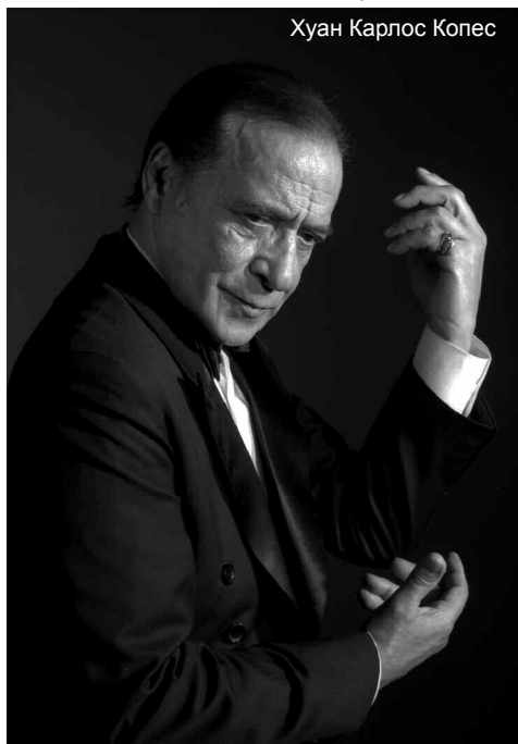
Хуан Карлос Копес

могла ограничиваться только теми арабесками танца в паре, что были общеизвестны, хоть и удивительны. В своем усердии открытия нового опыта в танго я работал с хореографами в попытке пойти дальше.